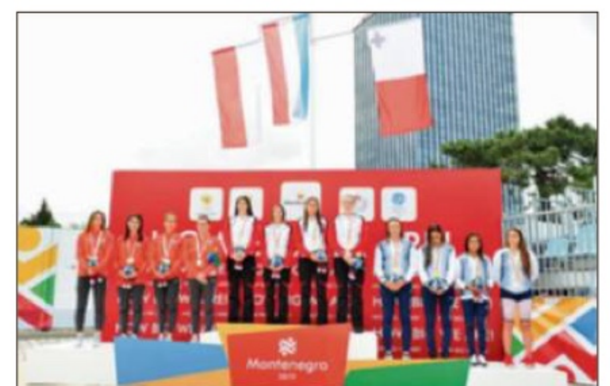
Le relais féminin de la natation (4 x 200m nage libre) sur la 2 e marche du podium.