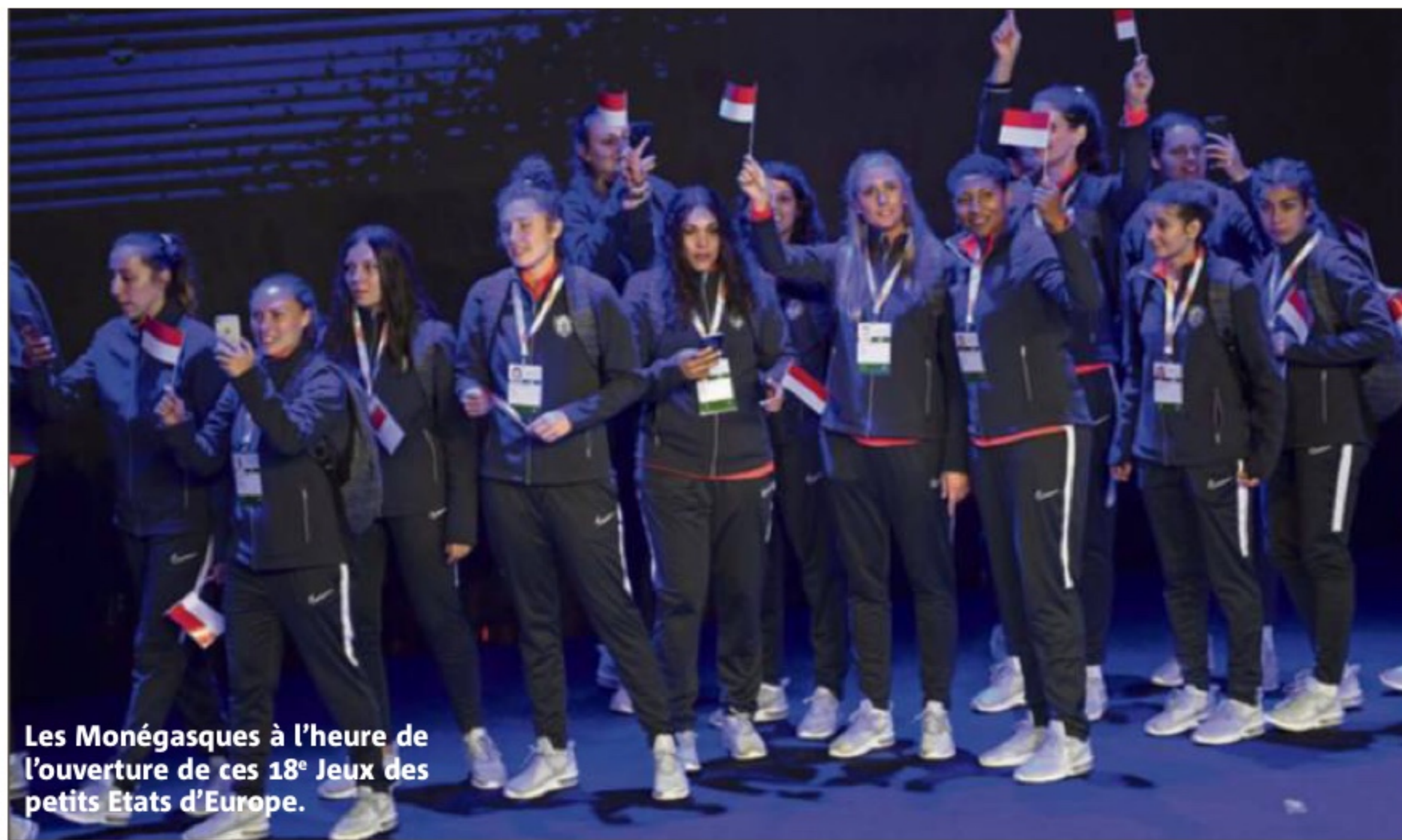
Les Monégasques à l'heure de l'ouverture de ces 18 es Jeux des petits États d'Europe.