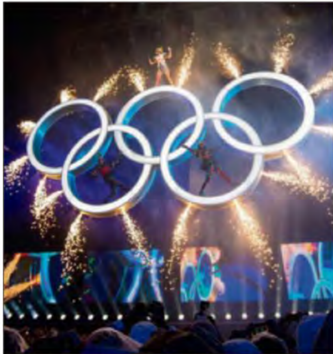
Les anneaux olympiques brillent dans le ciel argentin.

200 000 spectateurs ont assisté à la cérémonie d'ouverture, qui s'est déroulée sur la principale artère de la capitale argentine. Une première et un enthousiasme sans précédent