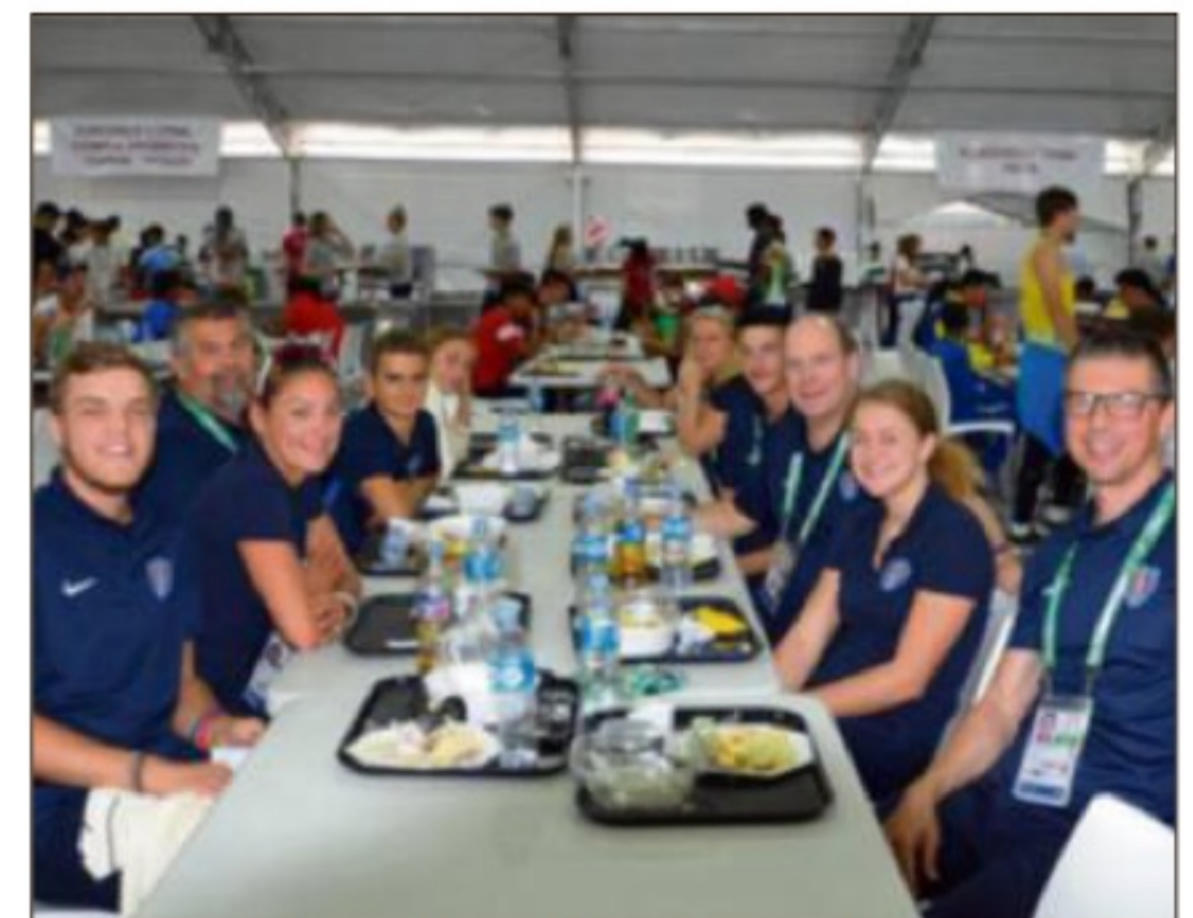
Le prince Albert II a déjeuné avec l'ensemble de la délégation monégasque dans le restaurant du village.